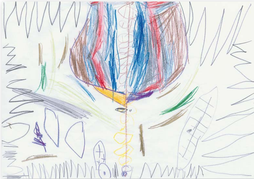
Dea, 5 Jahre